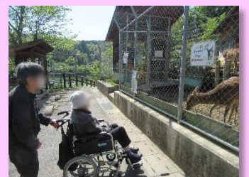
天候の良い日に愛宕山へドライブをしました。途中こいのぼりも見学し、春を感じる事ができ、大変喜ばれました。