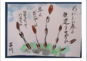
東棟F様の作品です