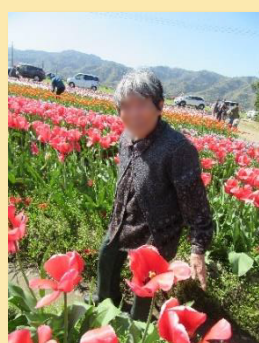
菜の花やチューリップを見に行きました。天候にも恵まれ、春を感じられ大変喜ばれました。