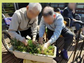
天候の良い日には、バルコニーにて外気浴や花の鉢植えをされ、穏やかな時間を過ごされました。