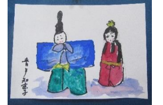
西棟 A 様絵手紙