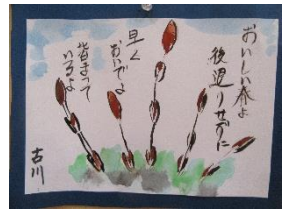
東棟 F 様絵手紙