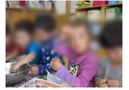
インゲン豆のすじ取りのお手伝いをするばんびさん