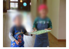
山森 (3、4、5 歳児) さんはよもぎ団子を縦割混合のチームで、楽しく作りました。