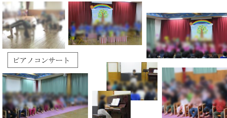
ピアノコンサート