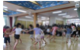
川・星・花さんも 大きくなりました