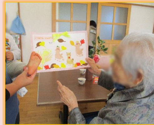
「かわいいね～ この足で作ったの？」