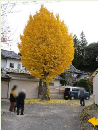
岩野薬師 イチヨウ 昔ここで運動会があって かけらかいたもんだわね～と 話も弾みました