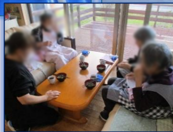
グループホーム出東ララの利用者さんが デイサービスの機械浴を利用に来られる こともあります。入浴後は一緒に ゲームを楽しみました