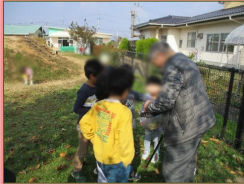
「なにになに？見せて～」 「カマキリだよ」