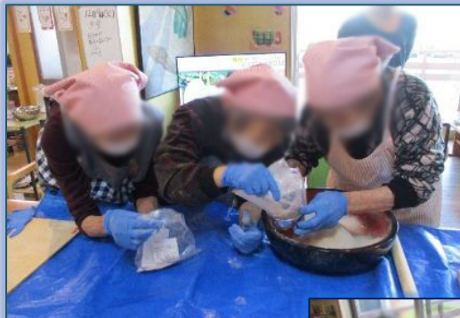
グループホーム出東ララへ そば打ち交流に…