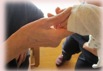
「ちっちゃなおててだね～」